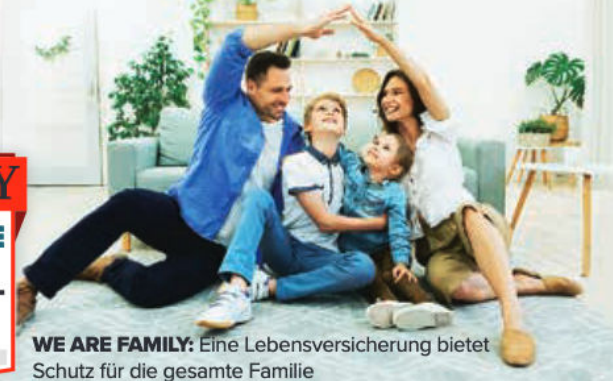
WE ARE FAMILY: Eine Lebensversicherung bietet Schutz für die gesamte Familie